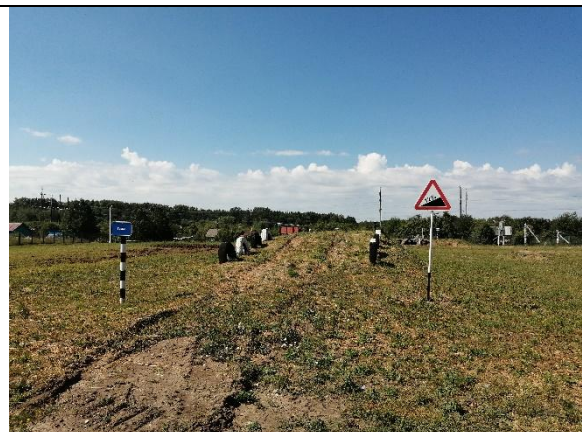
Участок профессионального обучения трактористов, машинистов и водителей самоходных машин