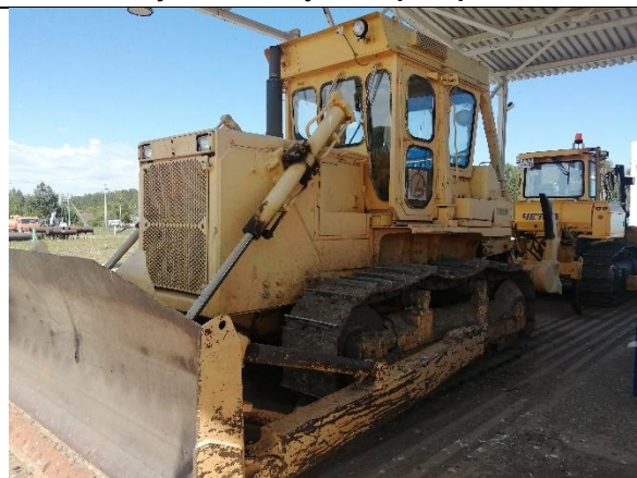
Гусеничный бульдозер Komatsu D85