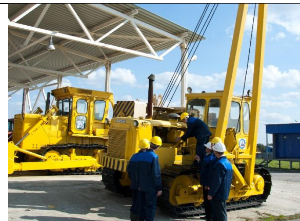
Трубоукладчик Caterpillar G-572