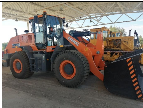
Фронтальный погрузчик UMG