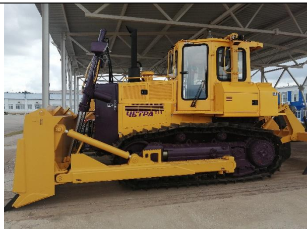
Гусеничный бульдозер Четра Т11