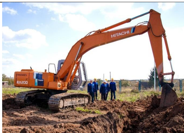
Гусеничный экскаватор Hitachi EX 200-2